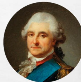
STANISŁAW AUGUST PONIATOWSKI

KONSTYTUCJA 3 MAJA 1791 R. ZOSTAŁA UCHWALONA PRZEZ SEJM WIELKI, ZWANY RÓWNIEŻ CZTEROLETNIM. BYŁA TO NAJWAŻNIEJSZA REFORMA TEGO SEJMU. AUTORAMI KONSTYTUCJI BYLI IGNACY POTOCKI, HUGO KOŁŁĄTAJ ORAZ KRÓL STANISŁAW AUGUST PONIATOWSKI.